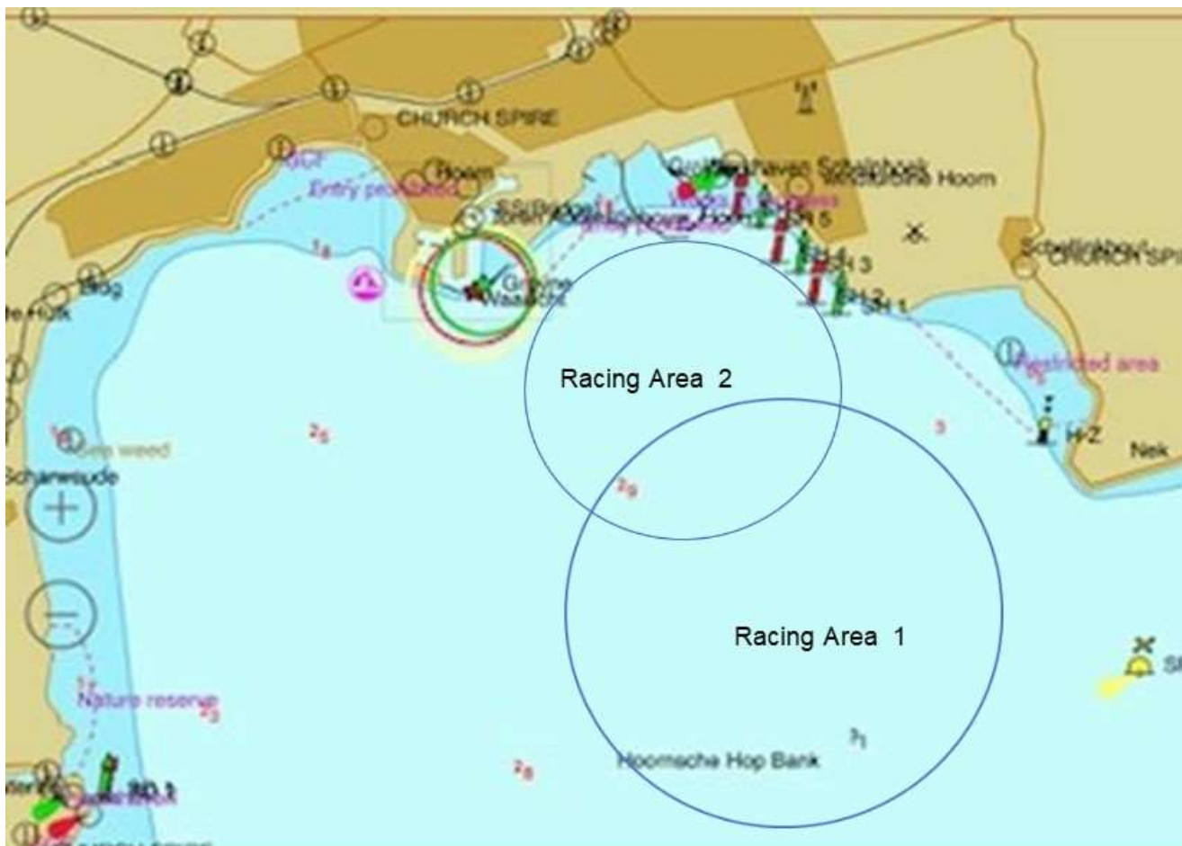
Racing Area 1 en Racing Area 2