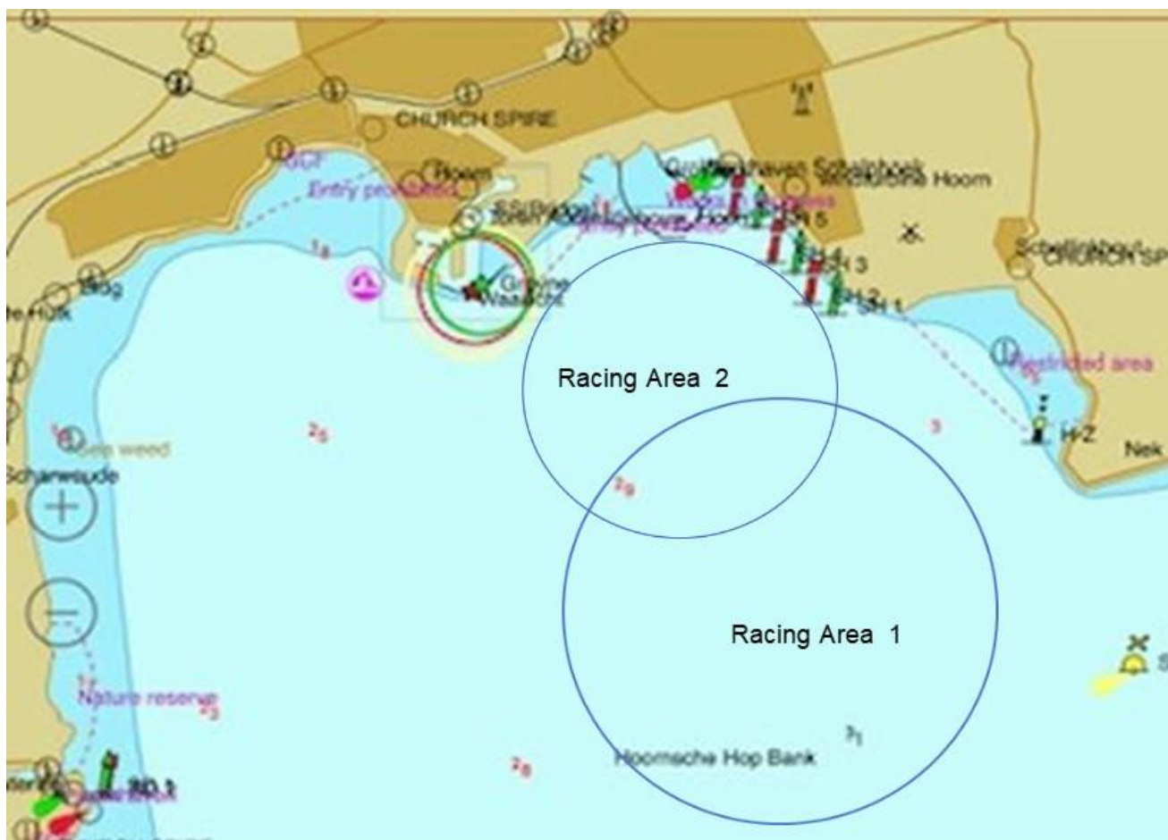
Racing Area 1 en Racing Area 2